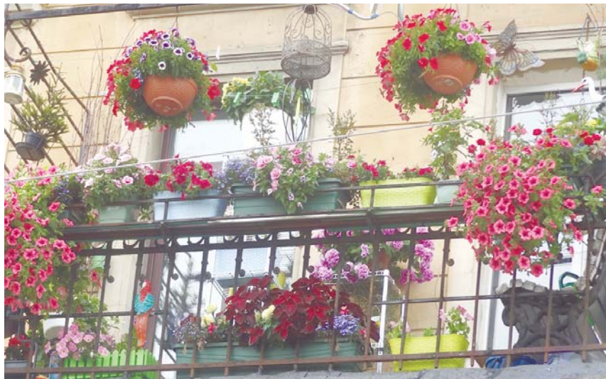
«Победитель в номинации «Лучший балкон» (2016 год)».

Местная Администрация внутригородского Муниципального образования Санкт-Петербурга Муниципальный округ Лиговка-Ямская напоминает, что продолжается прием заявок на лучшее оформление балконов, клумб, цветников на придомовых и дворовых территориях внутригородского Муниципального образования Лиговка-Ямская «Лучшая клумба (балкон)».